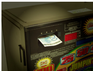
NV8/NV10 im Bally Wulff-Gerät

Der Vorteil liegt im weitaus günstigeren Beschaffungspreis und darin, ihn mit der selben Elektronik wahlweise in die Spielgeräte der verschiedenen Hersteller einbauen zu können. Diese Flexibilität macht dieses Produkt einmalig in der Branche und sichert die getätigte Investition. Aber auch in puncto Zuverlässigkeit und Sicherheit sind sie vergleichbar mit der Originalware der einzelnen Hersteller.