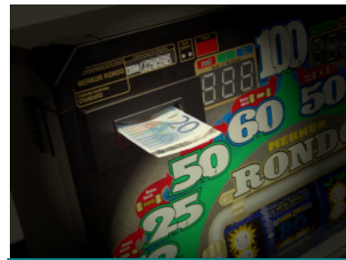
NV8/NV10 im adp Gauselmann-Gerät

Jede der vier Scheinsorten, mit denen der NV4 und NV8/NV10 gespeist werden kann, lässt sich durch Umlegen eines DIP-Schalters ganz einfach sperren. Bei passender Einstellung im Spielgerät nimmt er auch nur die Scheinsorten an, die das Spielgerät zulässt. Diese Funktionen dienen dazu, das Spielgerät vor Missbrauch als Geldwechsler zu schützen.