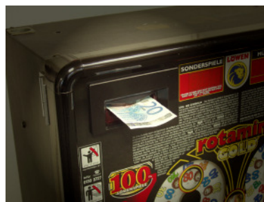
NV8/NV10 im NSM Löwen-Gerät

Die neue AgentSmiley 2004 ermöglicht den Betrieb des NV8/NV10 in Spielgeräten der Hersteller adp Gauselmann, Bally Wulff und NSM Löwen. Die alt bewährte AgentSmiley V2 kann zwar nur in Spielgeräte des Herstellers adp Gauselmann betrieben werden, ist dafür aber für den NV8/NV10 und NV4 geeignet. Für jeden der drei Hersteller sind passende Blenden, Halterungen und Fallkassette erhältlich, die den problemlosen Einbau oder Umbau von einem Gerätetyp zum anderen Gerätetyp erlauben.